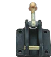
フックベースアッセン